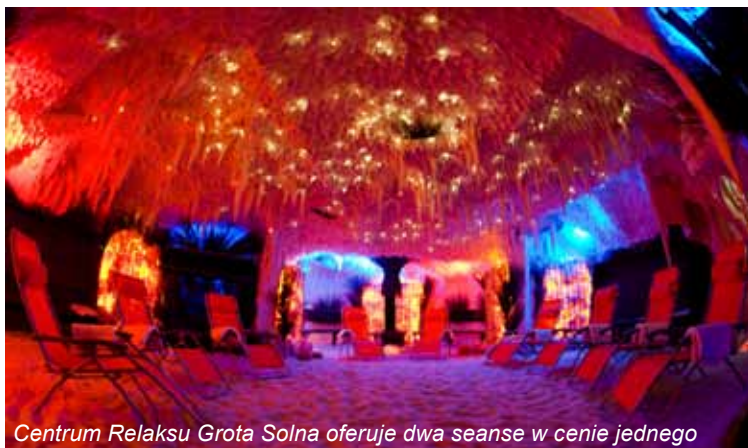
Centrum Relaksu Grota Solna oferuje dwa seanse w cenie jednego

mieszczenie na parterze lub w podziemiach budynku, którego ściany wyłożone są blokami solnymi, pochodzącymi najczęściej z Morza Bałtyckiego, Czarnego lub Martwego – ta sól jest uważana za najlepszą, ponieważ koncentracja minerałów i pierwiastków